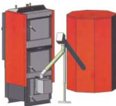
Kotel s horákom, slimákovým dopravníkom a zásobníkom.

Laddomat 21 svojou konštrukciou nahrádza klasické zapojenie z jednotlivých dielov. Skladá sa z liatinového telesa, termoregulačného ventilu, čerpadla, zo spätnej klapky, guľových ventilov a teplomerov. Teplota otvorenia termoregulačného ventilu je 78 alebo 72 °C podľa typu termopatrony.